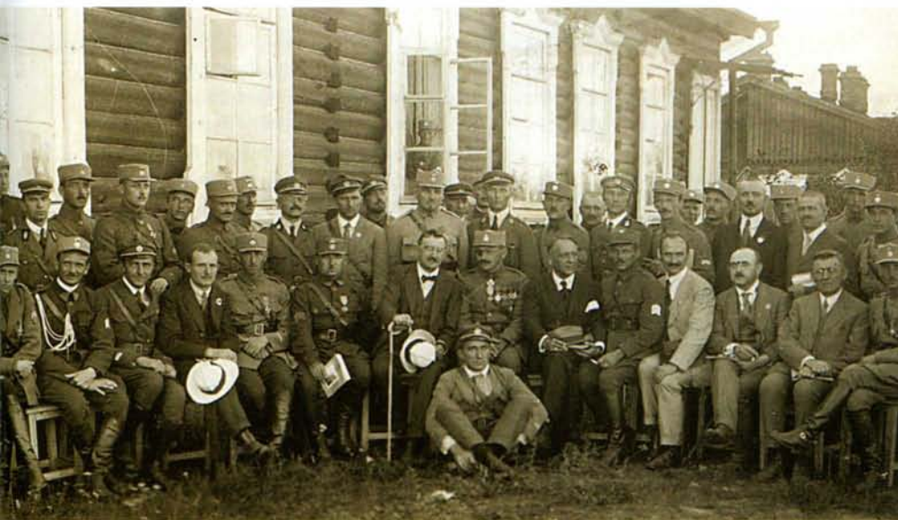
Делегация Чехословацкого национального собрания, прибывшая к чехословацким цвойскам в Сибири. В центре сидят: слева подполковник К. Кутлвашр, генерал С. Чечек, депутат Ф. В. Крейчи, генерал Я. Сировы; за Ф. В. Крейчи стоит дипломат Б. Павлу. Иркутск, 27 августа 1919 года.