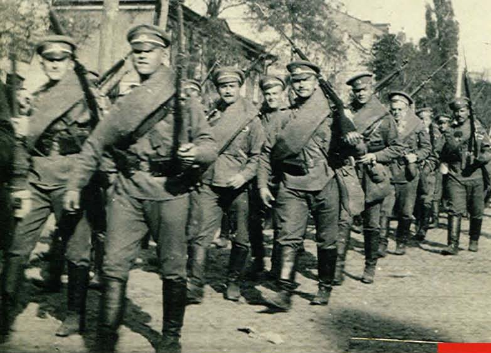
Добровольцы Чешской Дружины возвращаются с ежедневных учебных занятий в окрестностях Киева. Сентябрь 1914 года.