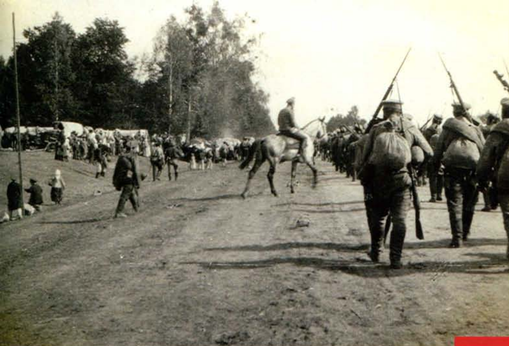
Добровольцы Чешской Дружины отступают с Русской армией после прорыва фронта в Горлице. У Брест-Литовска, май 1915 года. Частная коллекция.