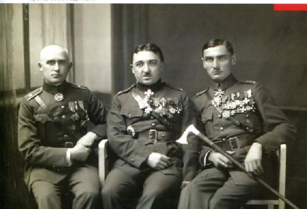
Майор К. Цейп, генерал Ст. Чечек и полковник Й. Вухтерле. Прага, 1922 год.

После приезда на родину и краткого отпуска, проведенного у родителей во Вранове, в августе 1920 года он был назначен заместителем начальника Ликвидационного отделения заграничных войск Министерства обороны в Праге. Там он проработал год. Как заслуженный легионер он был назначен начальником Канцелярии Чехословацкой Легии при Министерстве обороны 35 . К 1922 году он был награжден шестнадцатью чехословацкими, российскими и иностранными орденами.